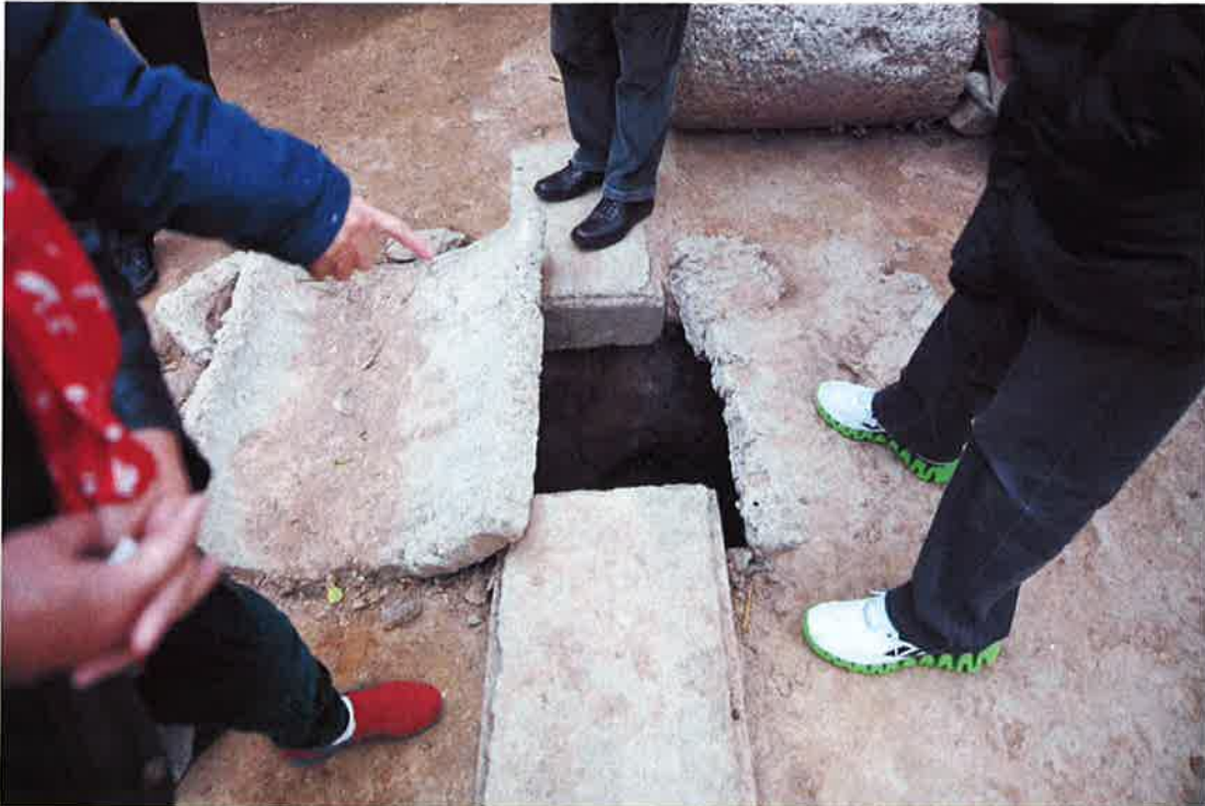
***** 照片2 *****