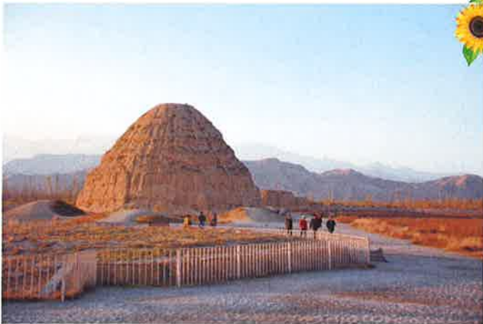
遊覽有東方金字塔之稱的西夏王陵