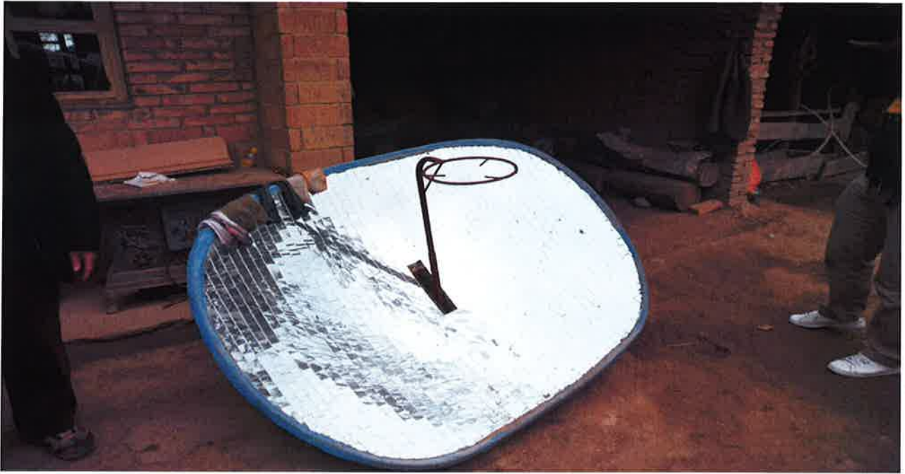
***** 照片1 *****