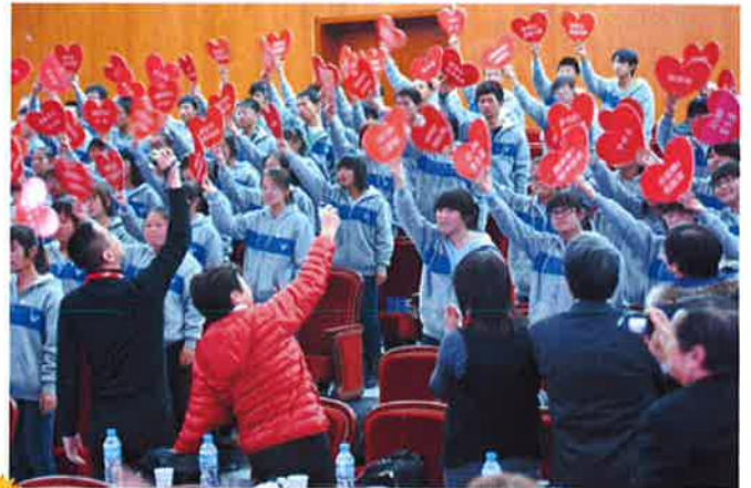
寧大結對儀式合唱「海鷗」