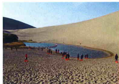
沙泉相依、沙不掩泉、泉不枯竭的神奇美景 - 月牙泉