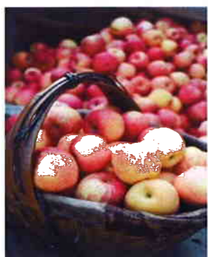
團友們讚不絕口的天水蘋果