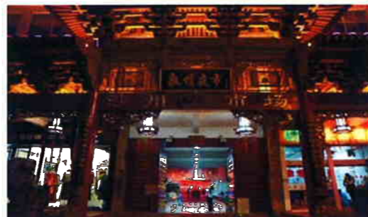
建築美輪美奐的敦煌夜市