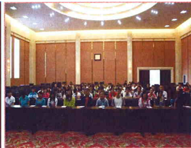
與內蒙醫學院同學舉行座談會