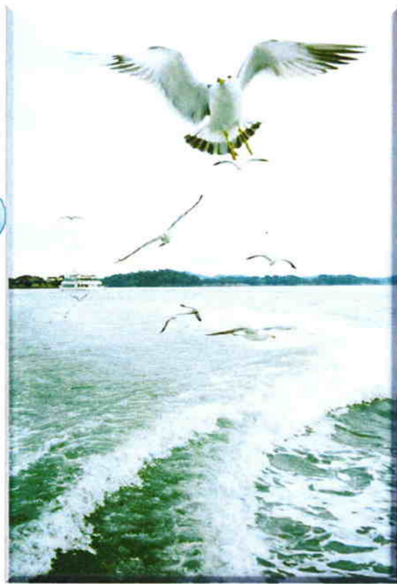
攝於2008年5月份，日本松島